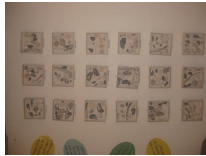
Rammerne med muslingeskaller.