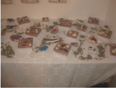
Æsker og malede sten blev også vist frem.